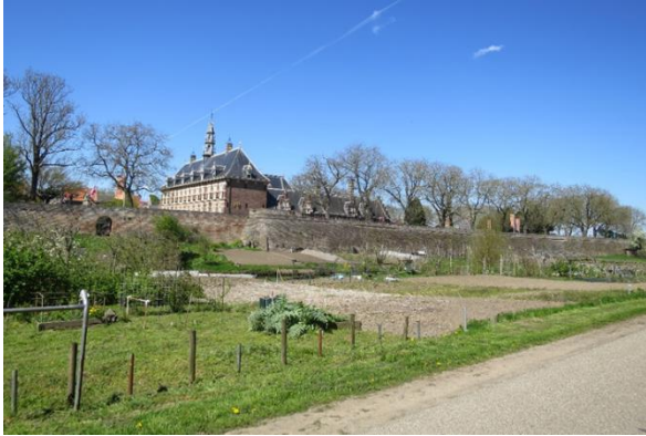
Zicht op Buren, ommuring en weeshuis vanaf de Blantensedijk