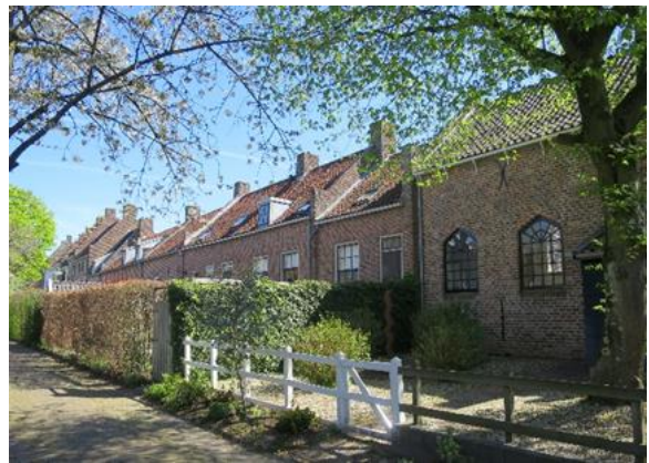
Achterzijde van de muurhuizen vanaf Het Stek