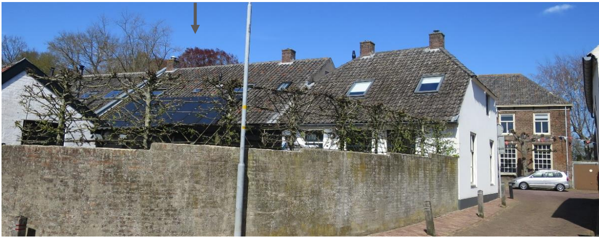
Vier voorbeelden in Buren waar zonnepanelen niet hebben geleid tot een onevenredige versterking van het stadsgezicht