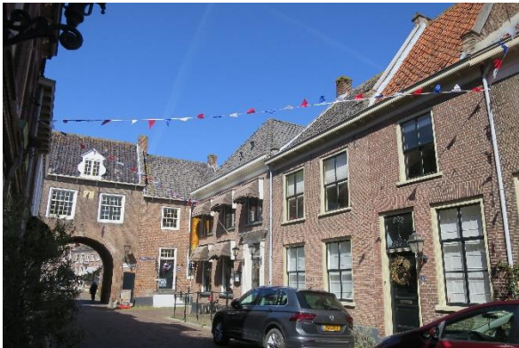
Voorstraat en de Huizen- of Culemborgse poort