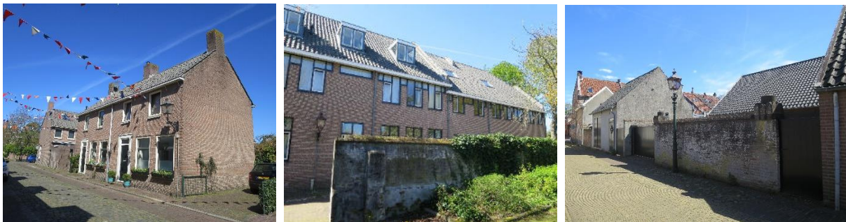
Foto's van locaties (vlnr; Weeshuisstraat, Schoolsteeg en Bergstraat) waar een merendeel van de respondenten zonnepanelen in het zicht vanaf de straat minder storend vinden.

Aan de hand van foto's zijn voorkeuren gepeild voor locaties waar naar mening van de respondenten, zonnepanelen eventueel zichtbaar mogen zijn. Op een aantal locaties in de Bergstraat, Nachtegaalstraat, Schoolstraat, Weeshuisstraat en het Plantsoen worden zonnepanelen vaker voorstelbaar gevonden dan bijvoorbeeld in de Voorstraat, Herenstraat, Peperstraat, Kniphoeck, Rodeheldenstraat, Weeshuiswal en vanaf de Tielseweg.