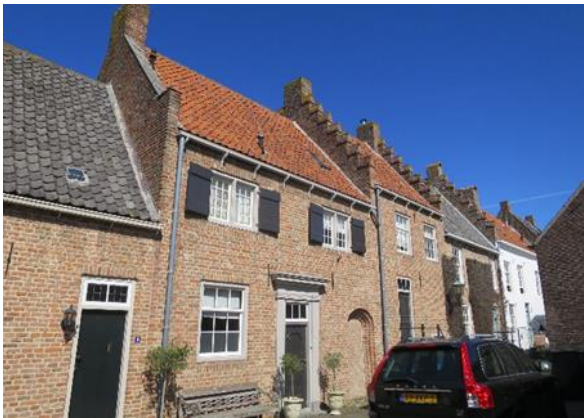
Muurhuizen langs Kniphhoek