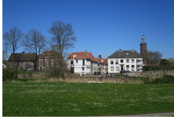
Zicht op Buren en de Vrouwen- of Tielsepoort vanaf de Tielseweg